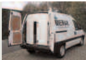
Onze koerierwagens houden uw tapes op de juiste temperatuur.

Honderden knappe koppen bij de grootste producenten van magnetische dragers verbeteren dag na dag hun producten. De evolutie van de laatste jaren is dan ook gigantisch. Maar zijn uw huidige tapes hierdoor al helemaal onkwetsbaar geworden? Tja ... technisch gesproken zijn de magnetische banden van vandaag amper te vergelijken met die van 50 jaar geleden. Toch blijft het oppassen.