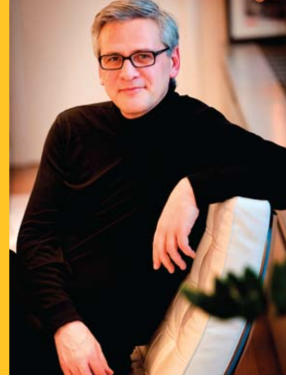
Kris Peeters , minister-president van de Vlaamse Regering – De minister-president werkt nauw samen met zijn departement.

"Ik denk spontaan aan twee voorbeelden van samenwerking met het Departement DAR. Het departement ondersteunde me als formateur met verschillende diensten waardoor ik samen met mijn collega's in de Vlaamse Regering snel opnieuw aan de slag kon gaan. De afgelopen jaren was het Departement DAR ook mijn belangrijke partner in het project Vlaanderen in Actie. De medewerkers hebben in dat project bewezen wat hun meerwaarde is: strategische en operationele ondersteuning van beleidsdomeinoverschrijdende initiatieven. Ook de volgende jaren reken ik op hen om ViA verder vorm te geven, de ambities te monitoren en te blijven werken aan een draagvlak via heldere en inspirerende communicatie."